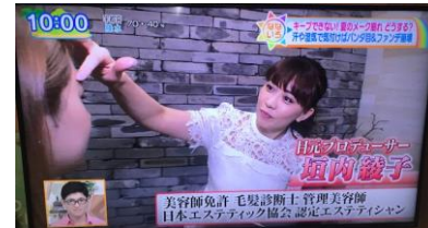
「なないろ日和!」(テレビ東京)