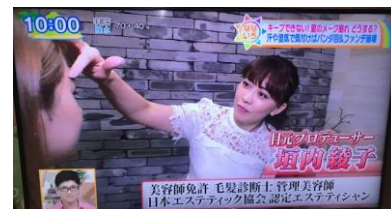
「なないろ日和！」(テレビ東京)